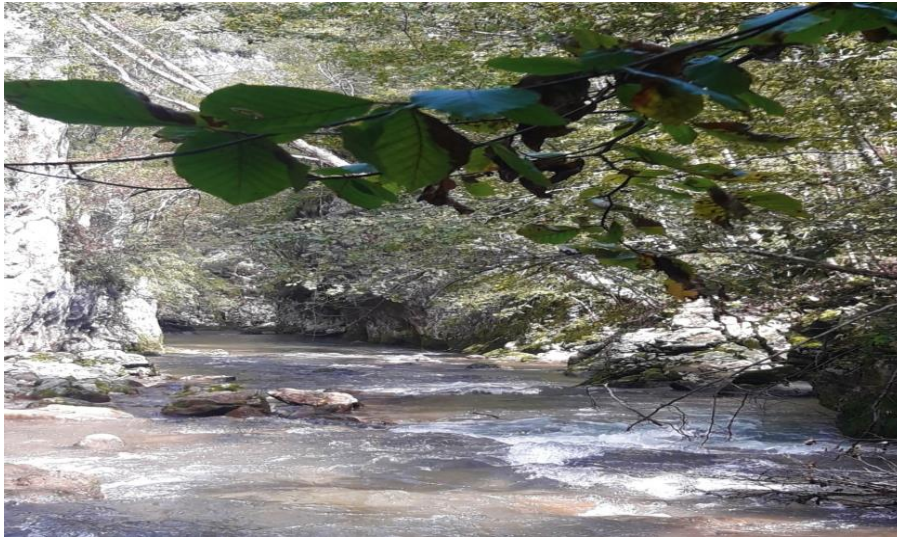
Sl. 1. Lokacija ispod planirane mašinske zgrade MHE "Luke"

Pokazalo se da i donošenje i primena propisa iz oblasti životne sredine, kao i obim promene koju reforma u ovoj oblasti donosi, u mnogome zavise od ostalih sektora, a najviše sektora planiranja i urbanizma, i energetike. S tim u vezi, primetna je veoma loša međusektorska saradnja, usled različitih ambicija koje ovi sektori imaju. Nedostatak inspekcijskog kapaciteta, kao i inspekcijski nadzor i volja, kako na republičkom, tako i na lokalnom nivou, izraženi politički uticaj na donošenje odluka, predstavljaju pored korupcije, neke od najvećih problema u oblasti vodnih resursa.