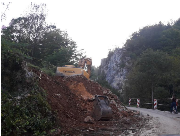
Sl.2. Lokacija obrušenog puta iznad lokacije na kojoj je početa gradnja MHE "Jovanovići" , selo Dobrače, Arilje

Pokazalo se da i donošenje i primena propisa iz oblasti životne sredine, kao i obim promene koju reforma u ovoj oblasti donosi, u mnogome zavise od ostalih sektora, a najviše sektora planiranja i urbanizma, i energetike. S tim u vezi, primetna je veoma loša međusektorska saradnja, usled različitih ambicija koje ovi sektori imaju. Nedostatak inspekcijskog kapaciteta, kao i inspekcijski nadzor i volja, kako na republičkom, tako i na lokalnom nivou, izraženi politički uticaj na donošenje odluka, predstavljaju pored korupcije, neke od najvećih problema u oblasti vodnih resursa.