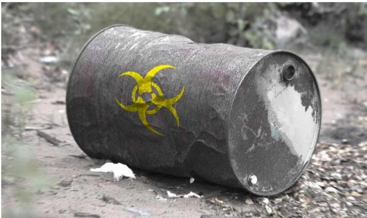
*Bure u kojem su bile skladištene cijanidne soli